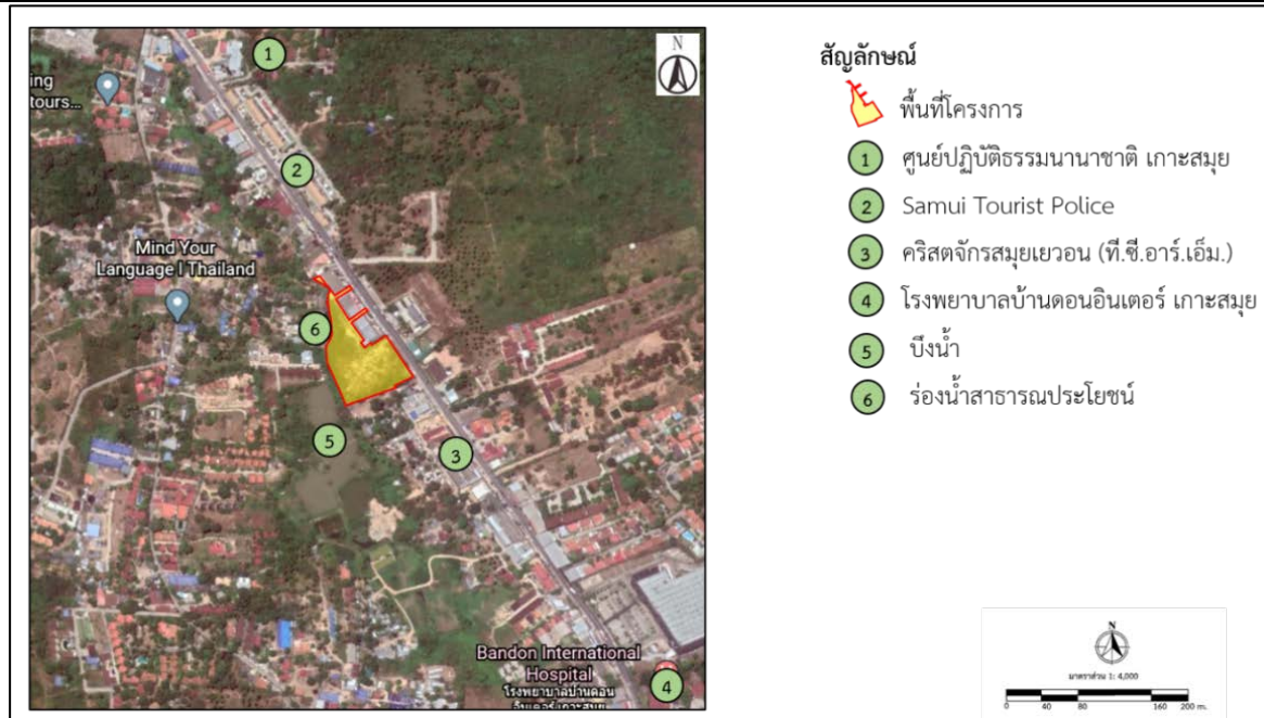
รูปที่ 1.2-1 แผนที่ตั้งโครงการ

ที่มา : บริษัท โรงพยาบาลวัฒนแพทย์ สมุย จำกัด, 2567